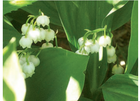
Text: Klaus Jäkel / Bild: Gaby Bessen In: Pfarrbriefservice.de

brechen sie auf die Knospen der Bäume die Keime der Erde die Zug- und Wandervögel des Frühlings sie machen es vor und laden uns ein – brecht auf ersteht jährlich neu