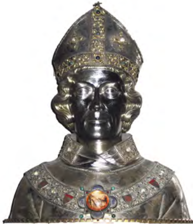
Büstenreliquiar von Erzbischof Willigis in St. Stephan

Erzbischof von Mainz (975 – 1011), Erbauer des Domes und von St. Stephan