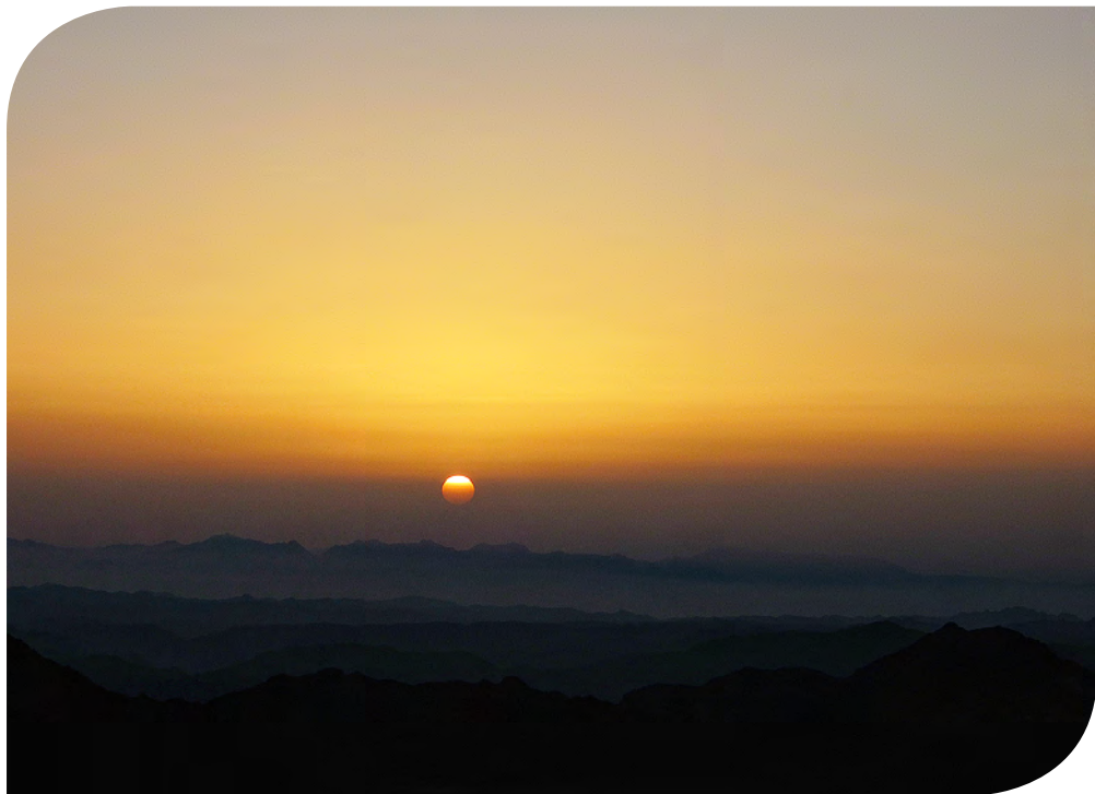
Sonnenaufgang am Sinai

Christus, dein Licht, verklärt unsre Schatten, lasse nicht zu, dass das Dunkel zu uns spricht. Christus, dein Licht erstrahlt auf der Erde, und du sagst uns: Auch ihr seid das Licht.