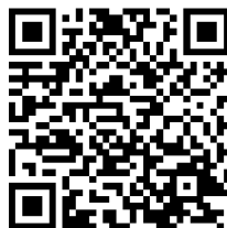
Zur Kinder- und Jugendumfrage